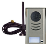
GSM-intercom Gebruik een GSM om de intercom te beantwoorden