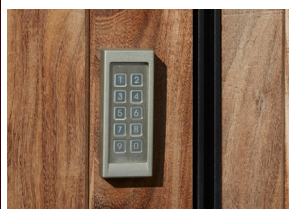
Codeklavier Krijg toegang door het intoetsen van de juiste code