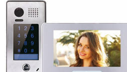
Videofoon Combineer scherm en intercom om bezoekers binnen te laten