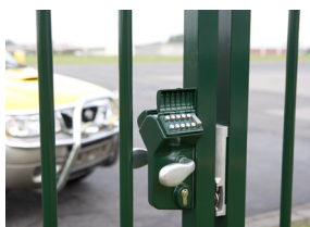
Mechanisch codeklavier Codeslot zonder elektriciteit of batterij