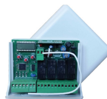
Ontvanger met plaatsgeheugen Via de display kunnen gebruikers afzonderlijk worden verwijderd en toegevoegd