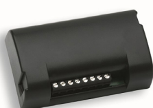
Ontvanger Ontvangt het signaal van één of meerdere zenders in nabijheid