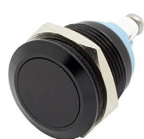
Druknop Krijg toegang door het drukken op de knop