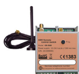
GSM-afstandsbediening Gebruik een GSM als zender