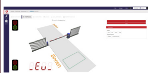
Gatestate-module Vergemakelijkt het beheeren van gebruikers en analyseren van storingen