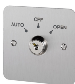
Sleutelcontact Open en sluit een poort, slagboom of draaitrommel met een sleutel